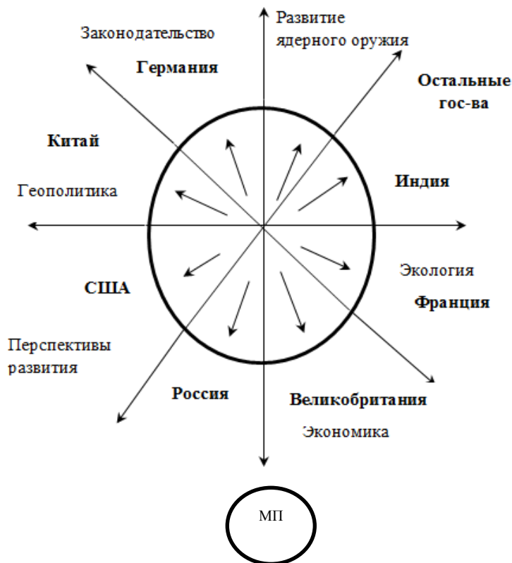
Рис. 2. Многополярная правовая модель информационного противоборства

Ряд ученых, по своим убеждениям близких к реализму, считает, что в период после окончания «холодной войны» на деле сложилась многополярная модель (рис. 2) системы международных правоотношений.