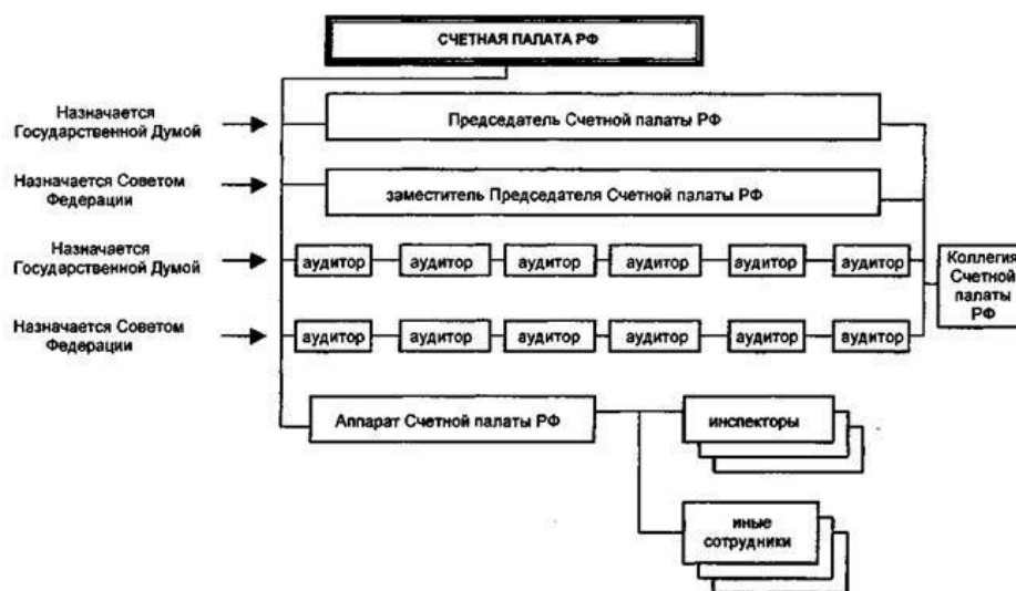
Рис. 1. Структура Счетной палаты РФ

Что касается аппарата, то его структура выражена в виде инспекторов, усилиями которых осуществляется контроль и ревизия (рис. 1) [4. С. 98].